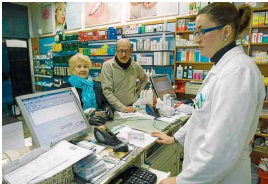
Una farmacèutica despatxant dos jubilats a Barcelona